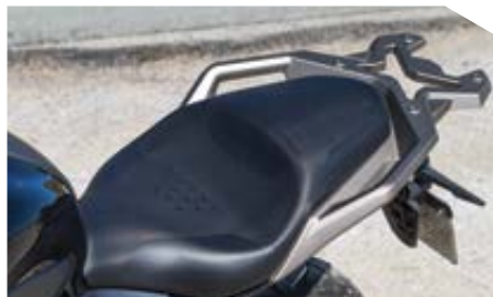
Η σέλα αποδείχθηκε αρκετά άνετη, κυρίως λόγω τους σχήματός της και της υποστήριξης μέσος που παρέχει.