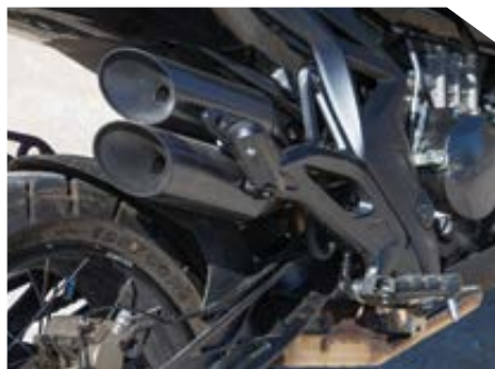
Χαρακτηριστική διπλή απόληξη της εξάμισης.