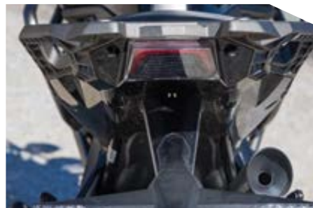
Και στο πίσω μέρος, ο φωτισμός είναι τύπου LED.

νει πλήθος πληροφοριών και 4 διαφορετικούς τρόπους απεικόνισης ανάλογα με τα γούστα του αναβάτη. Η οθόνη είναι ευανάγνωστη, αρκεί να μην την φωτίζει απευθείας ο ήλιος ο οποίος θα κάνει δυσχερή την θέαση της. Ακριβώς από κάτω της, βρίσκεται ένα μικρό ντουλαπάκι στο οποίο μπορείτε να βάλετε μικροαντικείμενα όπως κάρτες ή κέρματα. Στο εσωτερικό αριστερό μέρος των εμπρόσθιων fairing, βρίσκεται και η διπλή παροχή ρεύματος USB, που μπορεί να τροφοδοτήσει απευθείας κινητό ή GPS που ο αναβάτης τοποθετεί μπροστά του. Οι μανέτες συμπλέκτη και φρένου είναι ρυθμιζό-