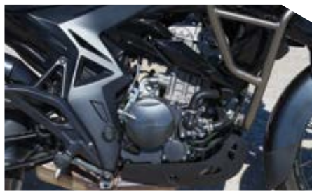
Γνωστός εδώ και χρόνια πλέον, ο ζωγράφος μονοκύλινδρος των 35,4 ίππων αποδίδει μια χαρά για τις ανάγκες και την αποστολή του 310T2.

Εκτός της πόλης, το 310T2 προσφέρει ικανή ανεμοκάλυψη στην εθνική και το 310T2 μπορεί να κρατήσει εύκολα ταχύτητες της τάξης των 120-130 χιλιομέτρων την ώρα για μεγάλα χρονικά διαστήματα. Ένα επίπεδο κραδασμών που παράγει ο κινητήρας στις ψηλές στροφές υπάρχει, αλλά δεν είναι ιδιαίτερα ενοχλητικό. Σε στριφτερά κομμάτια επαρχιακού, το μοντέλο δεν λείει όχι, ευνοώντας το ομαλότερο στυλ οδήγησης και προσφέροντας ικανοποιητικά περιθώρια πρόσφυσης ακόμη και για πιο γρήγορες βόλτες. Για το τέλος αφήσαμε την οδήγηση στο κόμμα, σημείο στο οποίο το T2 απέδωσε αξιοσημείωτα καλά, τηρουμένων και των αναλογιών του προσανατολισμού του. Με τις μαλακές αναρτήσεις και το «ατού» των ακτινωτών τροχών, το 310T2 κάνει την πρόσβαση σε εκτός δρόμου περάσματα εύκολη ακόμη και για λιγότερο έμπειρους, ενώ το ζύγισμα του αποδείχθηκε σωστά μελετημένο. Ακόμα, ο κινητήρας παραμένει ελαστικός χωρίς να γίνεται απότομος και χωρίς να «ξεκολλά» τον πίσω τροχό χωρίς να θέλει ο αναβάτης.