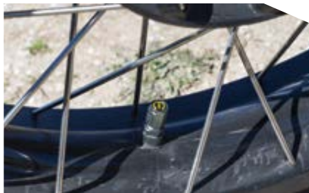
Ίδου τα ειδικά καπάκια των βαλβίδων, με τους πομπούς πίεσης-θερμοκρασίας για τις ενδείξεις του αναβάτη.

Την εμφάνιση των ενδείξεων αναλαμβάνει μια TFT οθόνη, η οποία περιλαμβάνει